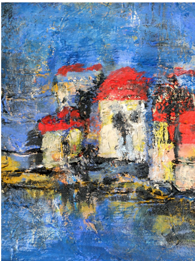
Auf der Lagune