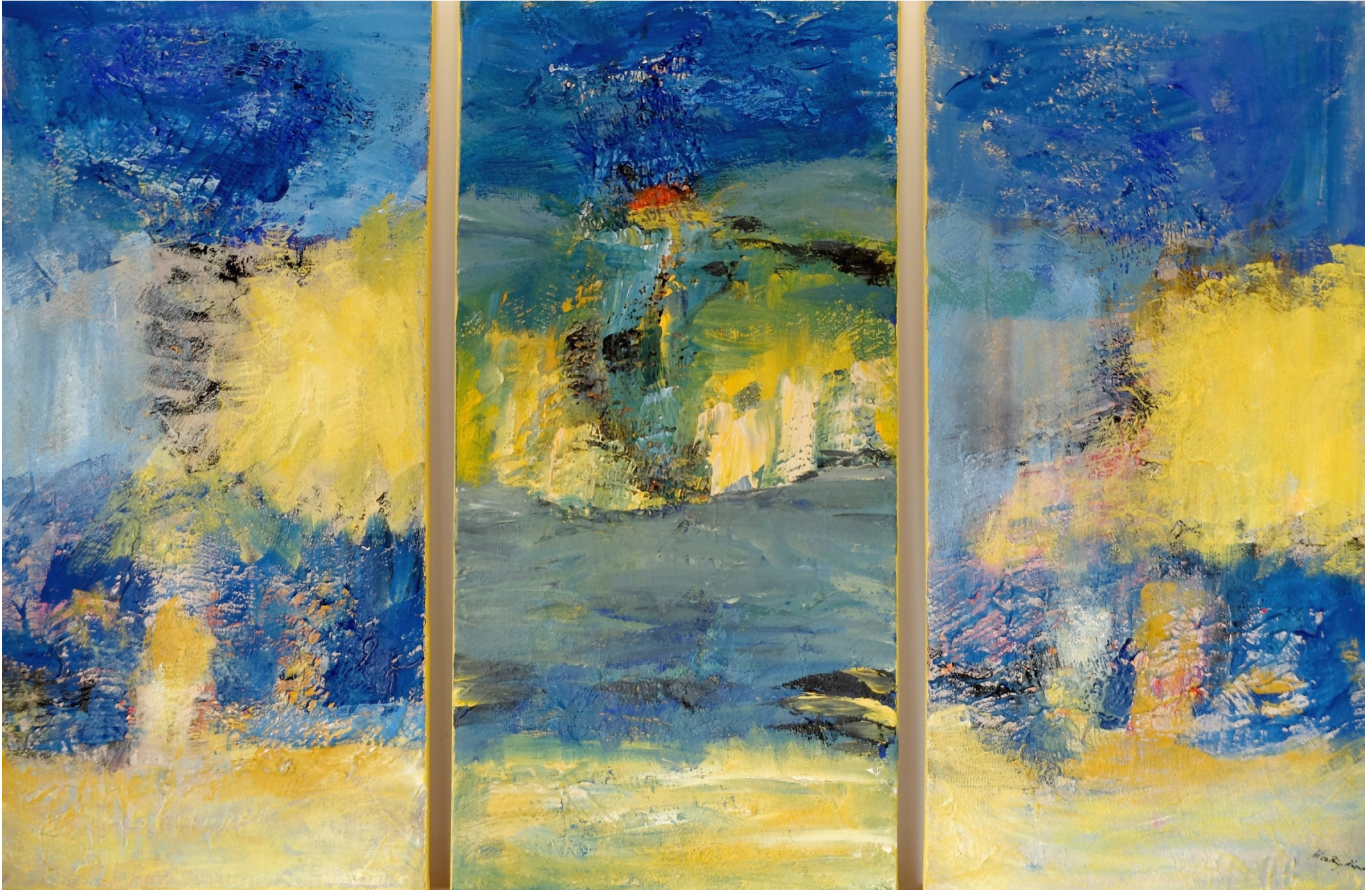
Frühling an der Klippe